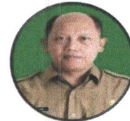
Kepala Sub Bagian Umum dan Kepegawaian pada Sekretariat SUBARJO, S.IP, M.Si